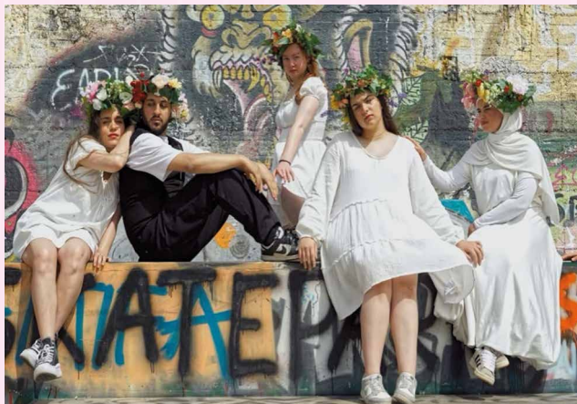
Thin Ice, 2025

Junge Menschen zwischen den Welten – auf der Suche nach ihrem Platz in einer Stadt, deren Geschichten nicht ihre sind. Denkmäler und Straßennamen sprechen von einer Vergangenheit, in der sie nicht vorkommen. Sie kämpfen um Anerkennung und suchen Freiräume. Hinterlassen wir ihnen eine Gesellschaft, in der sie ankommen können?