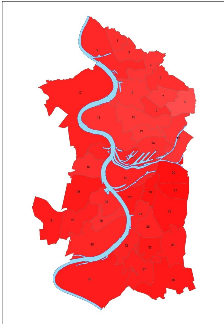
Abb. 2: Sieger in den einzelnen Kommunalwahlbezirken* (links: Stichwahl 28.09.25, rechts: Hauptwahl 14.09.2025)