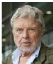
Hardy Krüger †

Hier eine Auswahl einiger der bekanntesten Künstler, die bisher in der „SÄULE“ aufgetreten sind: