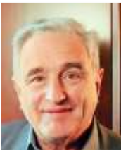
Michael Degen †