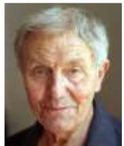
Heinz Bennent †