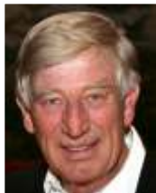
Siegfried Rauch †