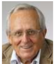
Dieter Hildebrandt †