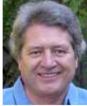
Christian Quadflieg †