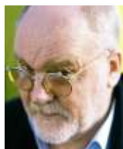
Hanns Dieter Hüsch †