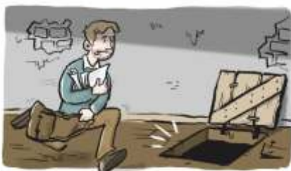
Illustration: Jonas Heidebrecht

Szenen aus der Graphic Novel „Duisburg 1933“