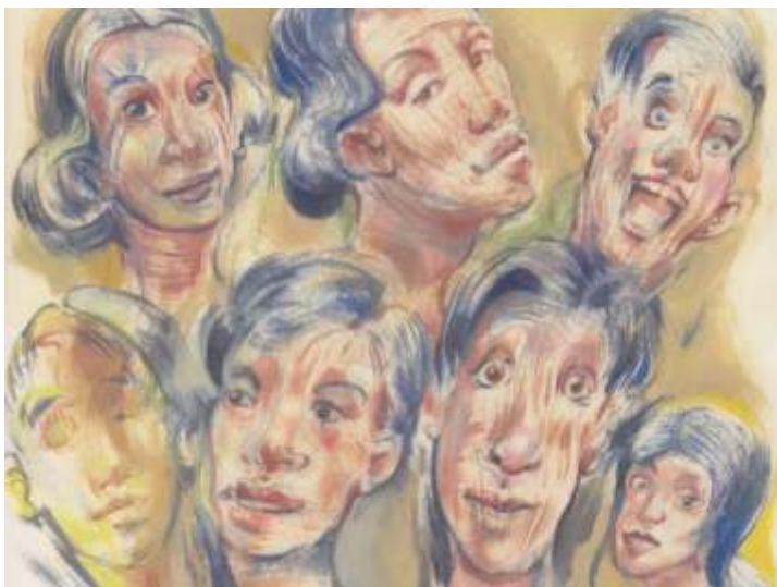
Illustration: „Köpfe“ von Jörg Mazur

Das Zentrum für Erinnerungskultur, Menschenrechte und Demokratie (ZfE) erinnert an die nationalsozialistische Vergangenheit Duisburgs. Daneben sind Migration sowie die Ausgrenzung und Diskriminierung diverser marginalisierter Gruppen zentrale Inhalte. Das ZfE arbeitet als Netzwerk, das mit Bildungsangeboten, Veranstaltungen und Ausstellungen die Auseinandersetzung mit diesen Themen in der Stadt fördert.