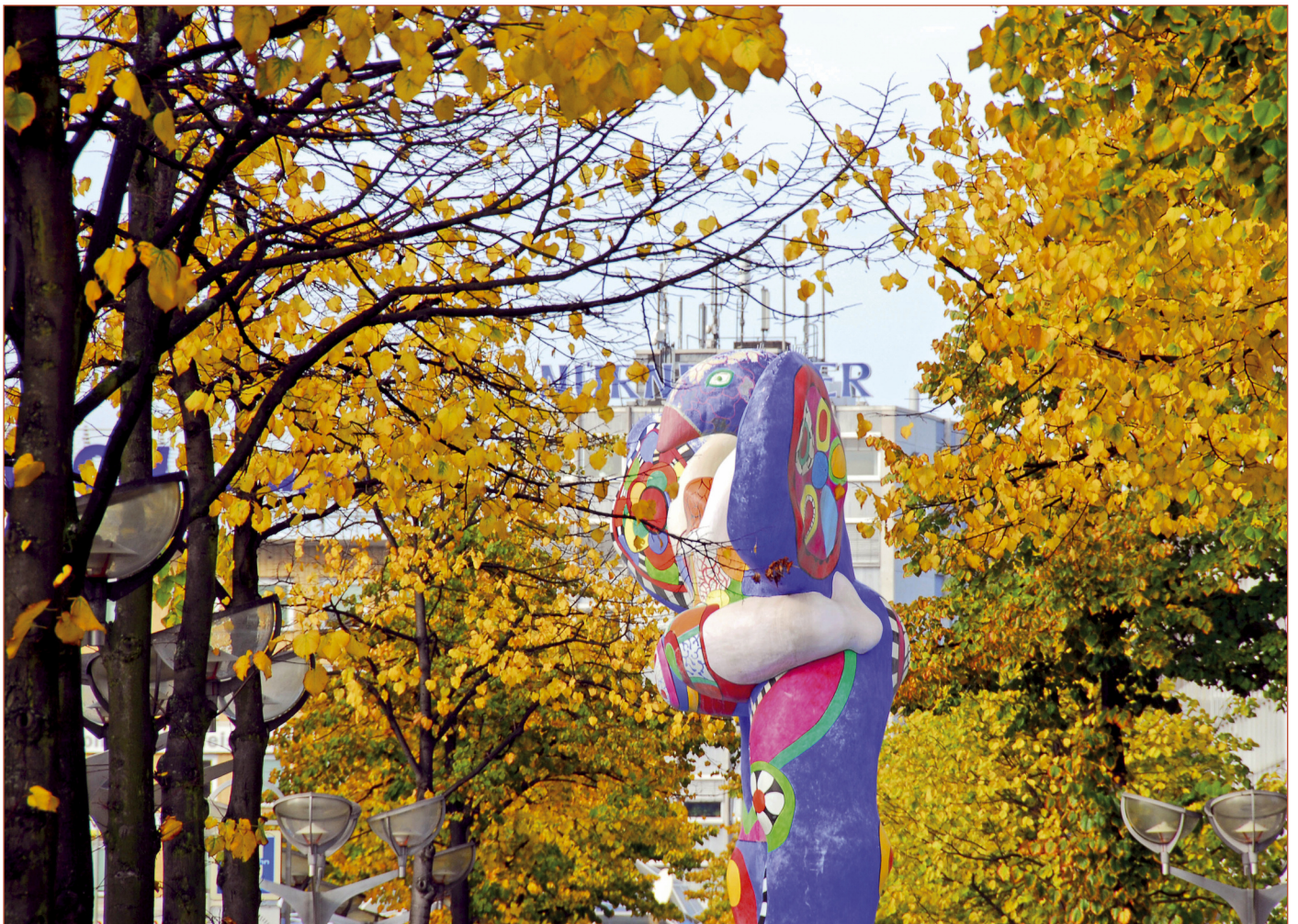
Auf der Königstraße leuchtet der Live Saver mit dem Herbstlaub um die Wette.

P.S.: Wie bereits bei den anderen Jahreszeiten-Heften kombinieren wir Kopiervorlagen für die Schülerinnen und Schüler mit Informationsseiten für Lehrer. Alle Seiten sind auch auf der Internetseite der Schulkulturkontaktstelle abrufbar.