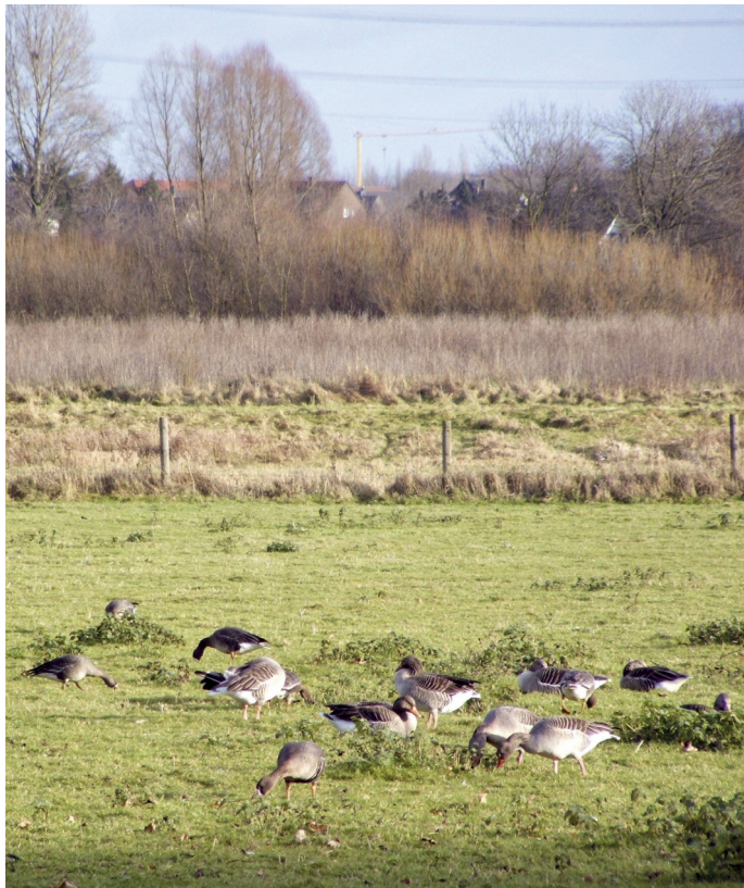
Gänse in der Walsumer Rheinaue.

So kann eine Sammlung von Bildern und Texten zu den Bäumen rund um die Schule entstehen. Denkbar sind auch die Gestaltung eigener Piktogramme zu den verschiedenen Bäumen und der Eintrag in den Stadtplan (Karte im Maßstab 1:9.000).