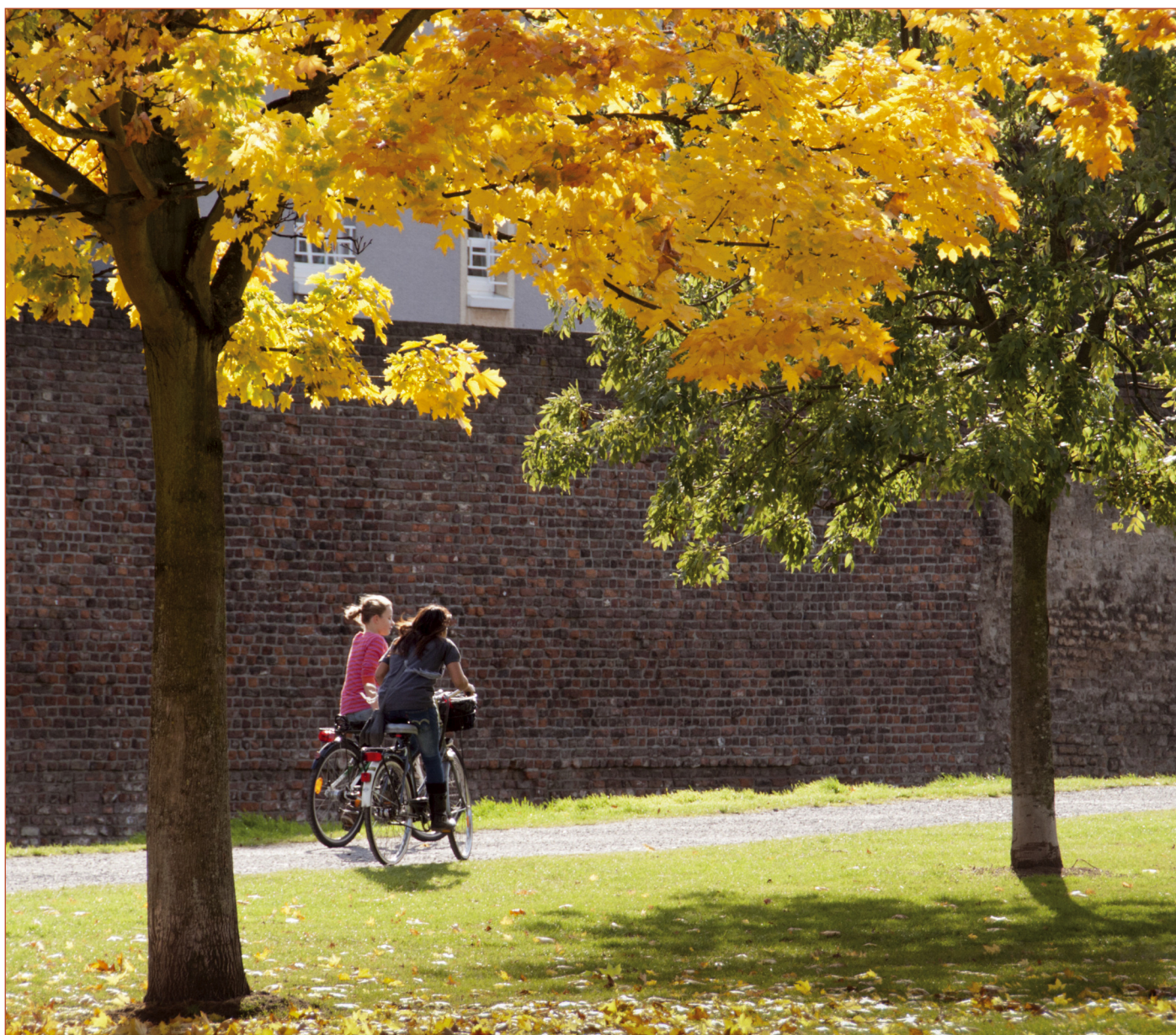
Fahrradtour im Herbst an der Duisburger Stadtmauer.

Mit dem Herbst verändert sich das Erscheinungsbild des Viertels. Das Arbeitsblatt lädt ein, die Veränderungen wahrzunehmen und zu beschreiben. Die Lösungen der Rätsel (Martinszug/Laubhaufen/unter einem Kastanienbaum/in der Weckmann-Bäckerei/eine Riesenpfütze) können vorgegeben werden, so dass sie nur noch zugeordnet werden müssen. Mit entsprechenden Symbolen lassen sich alle Herbst-Orte der Schülerinnen und Schüler in den Kulturstadtplan eintragen.