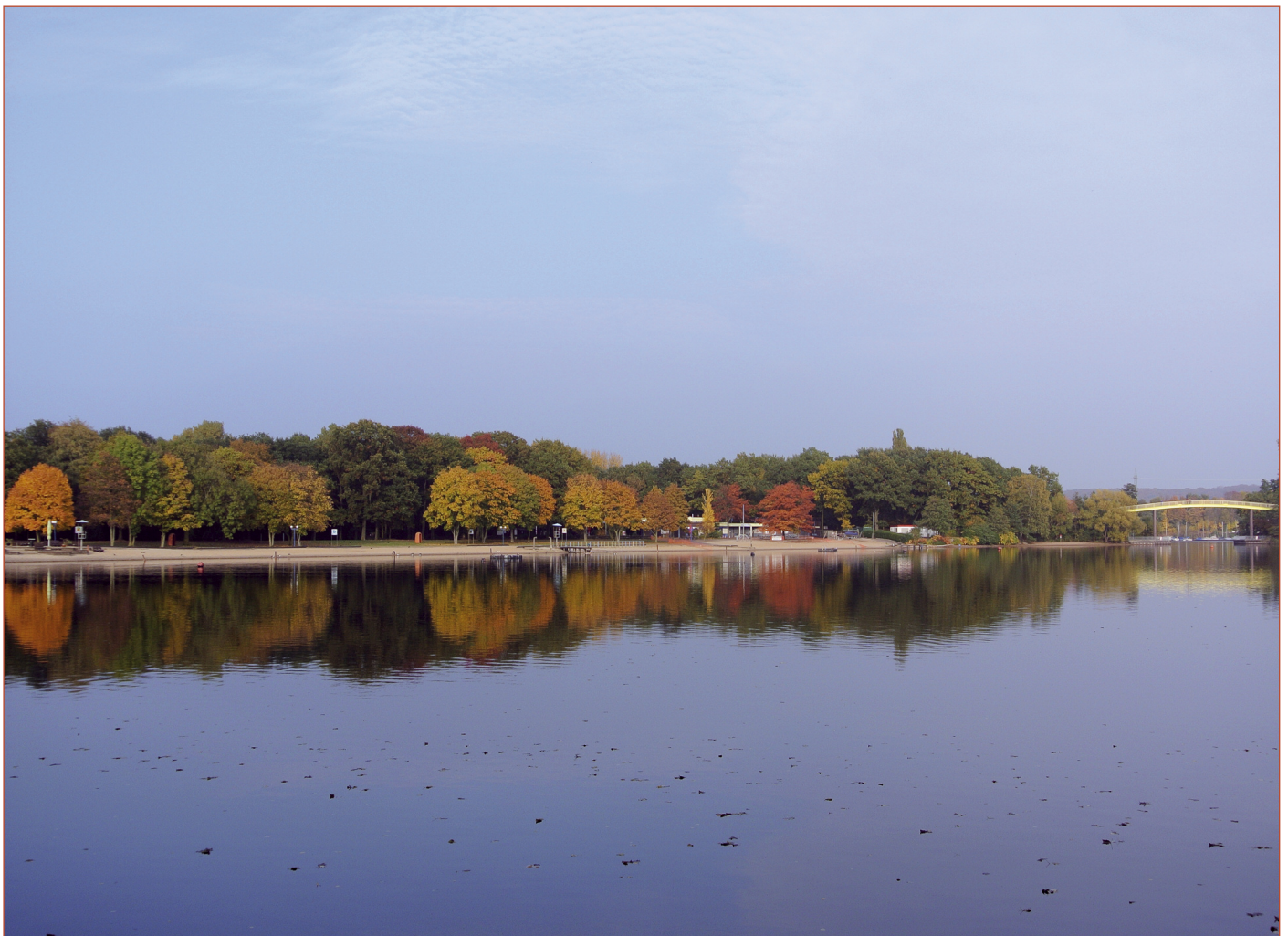
Der Sportpark Wedau grenzt im Süden an die Sechs-Seen-Platte. Hier ist viel Platz für Wassersport, zum Beispiel im Freibad Wolfsee.